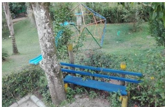
Parque de Arriba