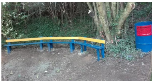
“Bosque de las brujas “