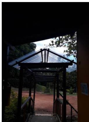
Acceso a Preescolar