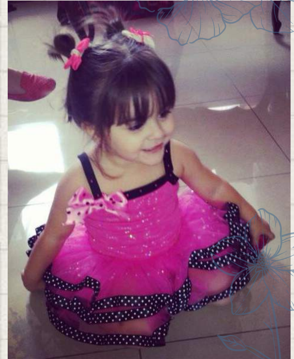
• Con capul