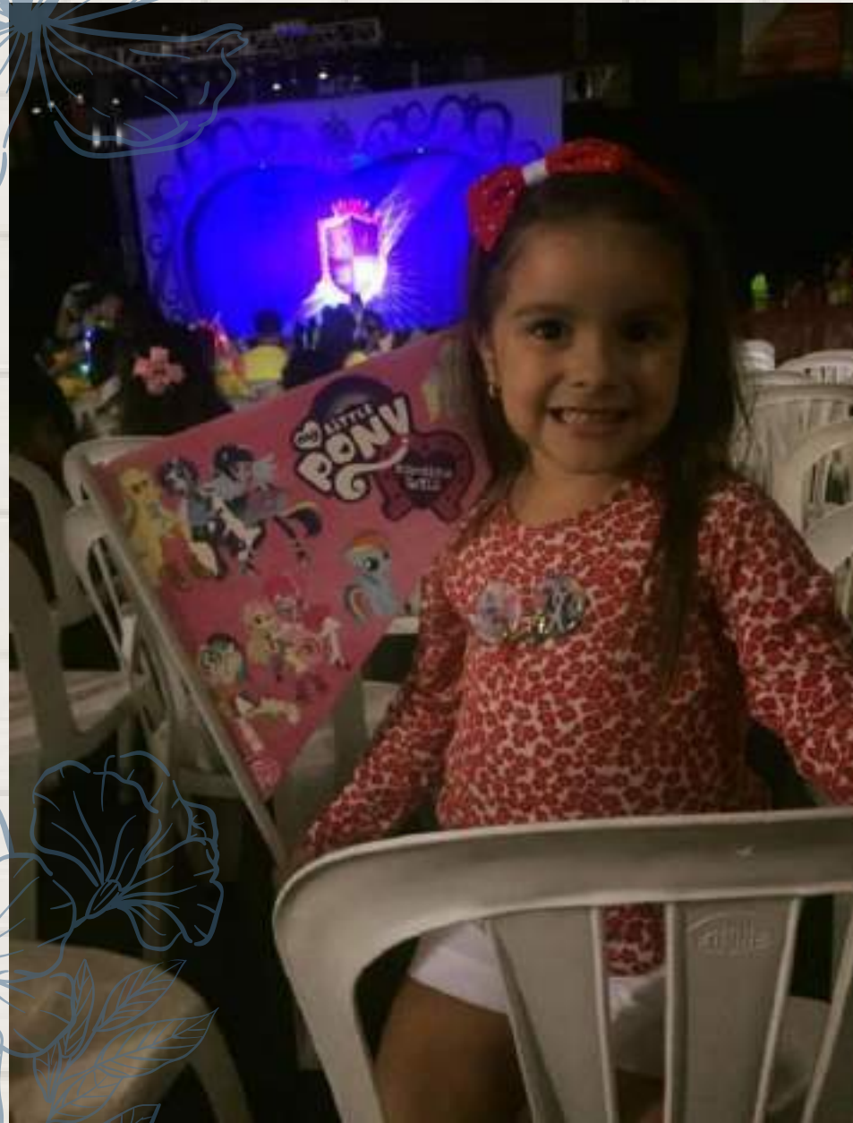
• Evento My little pony