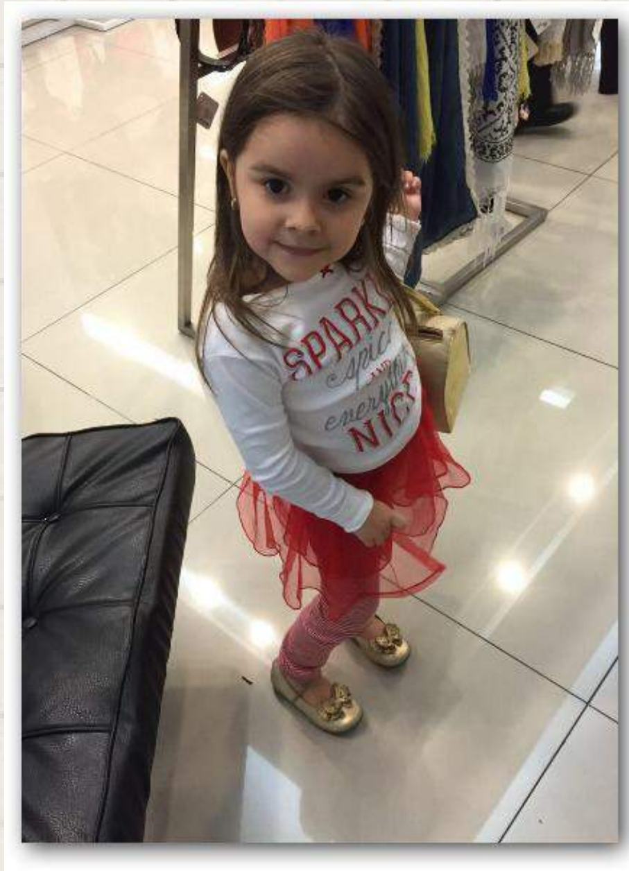
• Que elegancia la de francia